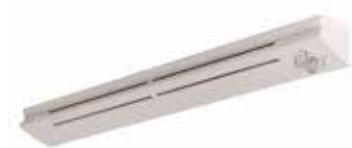
Entrada de aire higrorregulable EHL

La EHL es una entrada de aire higrorregulable ideal para las necesidades acústicas.